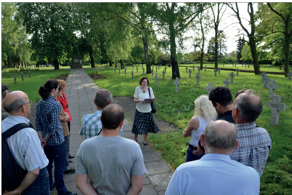
Ryc. 6. Spotkanie z cyklu „Muzealne Spotkania z Przeszłością” pt. Bez nadziei na powrót... Polska kwatera jeniecka z okresu II wojny światowej na Międzynarodowym Cmentarzu Wojennym w Stargardzie poprowadzone przez J. Aniszewską, 16 maja 2013 r.