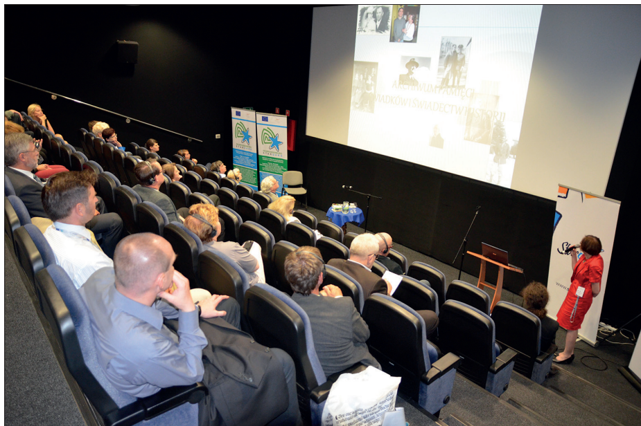
Ryc. 7. Polsko-niemiecka konferencja pt. Między tradycją a nowoczesnością. Polskie i niemieckie muzealnictwo na Pomorzu towarzysząca otwarciu wystawy stałej w Bastei, 13-14 czerwca 2013 r.