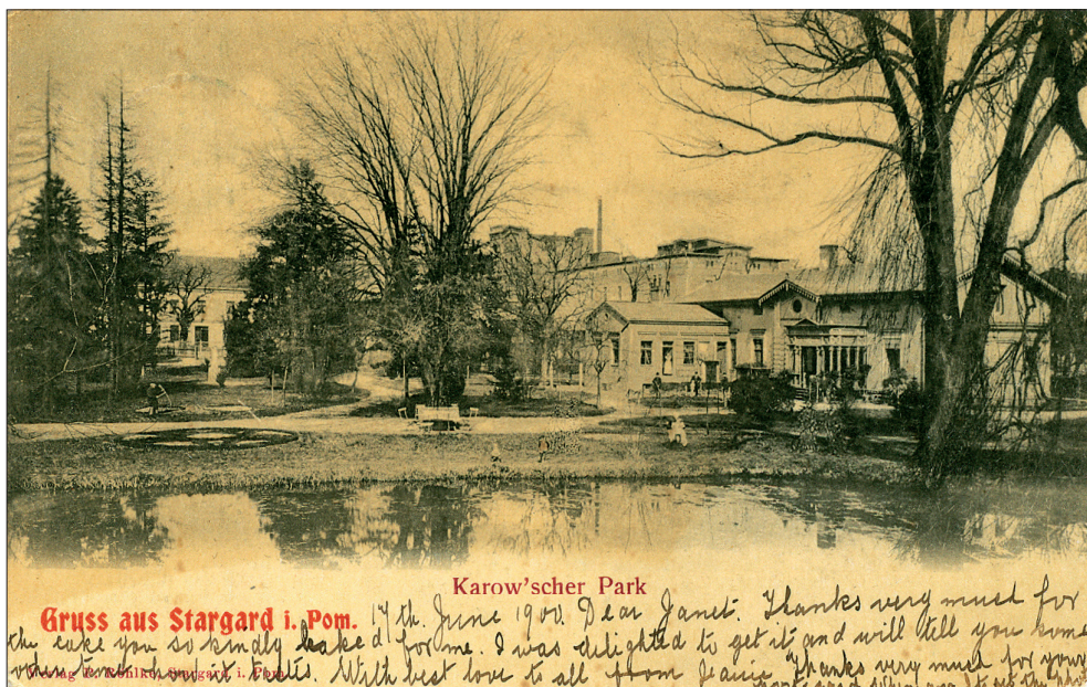
Ryc. 5. Kartka pocztowa przedstawiająca Karow'scher Park, P. Röhlke, Stargard i. Pom., około 1900 r. Zbiory MAH w Stargardzie, nr inw. MS/H/2603