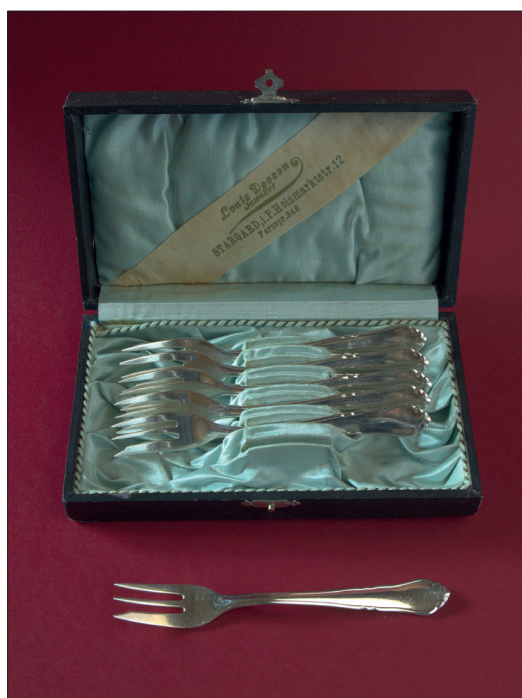
Ryc. 2. Zestaw widelców do przekąsek sprzedawanych w salonie jubilerskim Luisa Deesena przy Holzmarktstr. 12 (obecnie ul. Władysława Łokietka) w Stargardzie. Zbiory MAH w Stargardzie, nr inw. MS/S/1143.