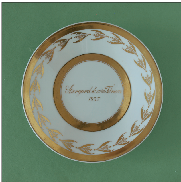
Ryc. 4. Porcelanowy talerzyk pamiątkowy z około 1827 r. wykonany przez KPM Berlin (Königliche Porzellan-Manufaktur Berlin). Zbiory MAH w Stargardzie, nr inw. MS/S/1144.