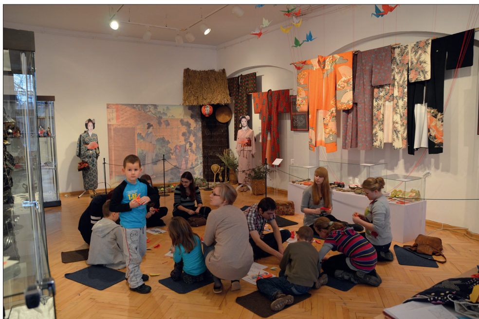
Ryc. 10. Zajęcia „Ferie z Japonią” na wystawie czasowej Kimono – przejaw japońskiej sztuki i tradycji , 31 styczeń 2013 r.